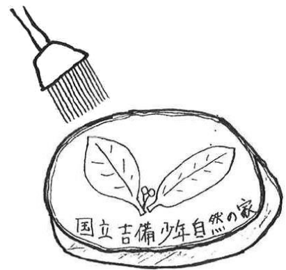
コースターに貼り付ける