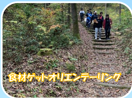
食材ゲットオリエンテーリング