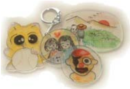
(プラホビー作成見本)