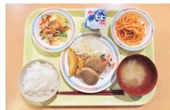
レストラン食の例(夕食)

※少人数でのご利用や閑散期の場合は、配膳方式へ変更する場合があります。 ※3歳以下無料 ※懇親会用のオードブルも承ります。(各種条件あり、要事前相談)