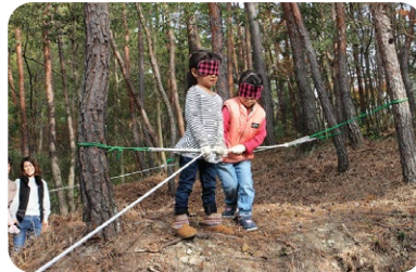
▲ブラインドウォーク