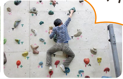
▲クライミングウォール