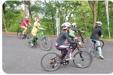
▲マウンテンバイク