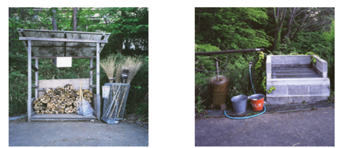
※薪置き場と掃除道具入れ。結束針回収場、消火バケツと水道、灰捨て場。