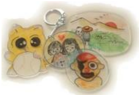
(プラホビー作成見本)