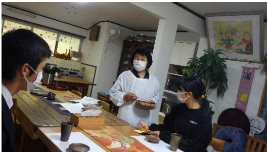
【フィールドワーク②】