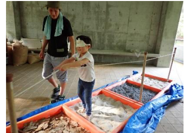
【裸足でチャレンジ】