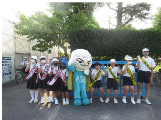
【あいさつ運動(小学校)】