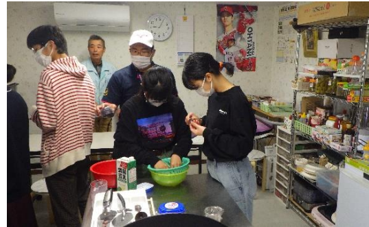
【フィールドワーク②】