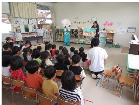
【絵本の読み聞かせ】