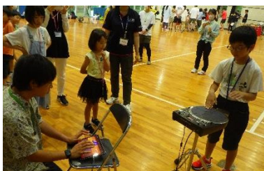
【電子楽器音楽アプリ体験】