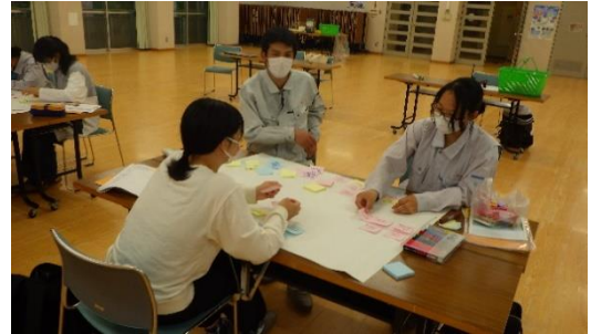
【講義・演習①「地域理解」】