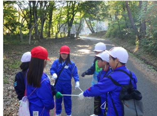
【スコアオリエンテーリング(ミッション)】