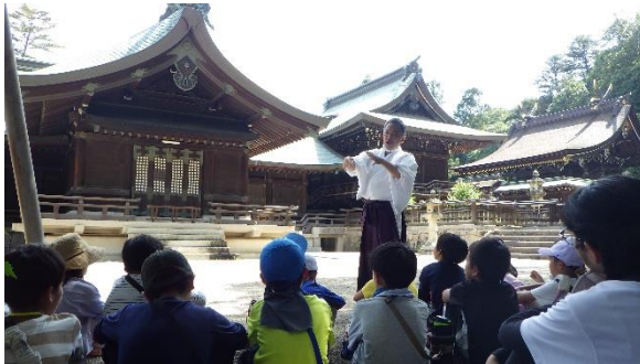
【吉備津彦神社講話】