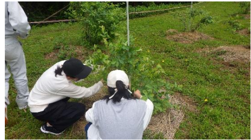
【フィールドワーク①】