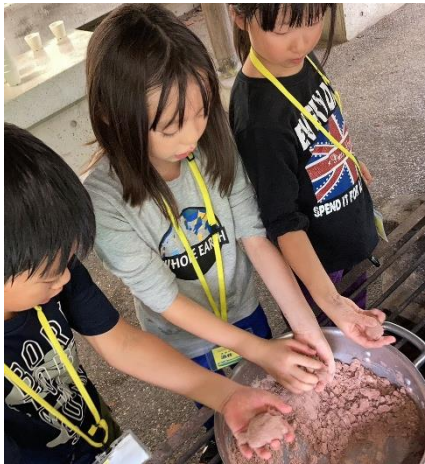
【きびだんごづくり】