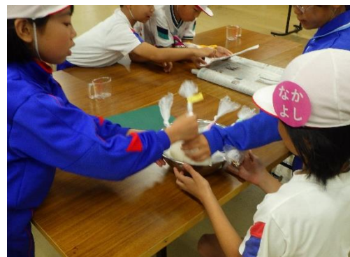
【野外炊事(ポリ袋炊飯カレー)】