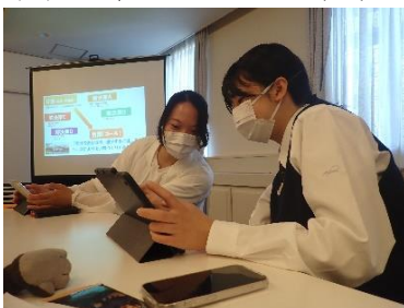
【講義・演習④「行動計画の基礎」】