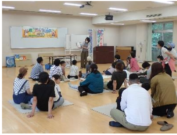
【絵本の読み聞かせ】