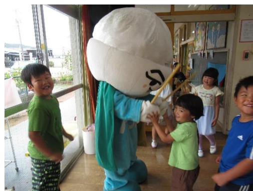
【ふれあい活動(保育園)】