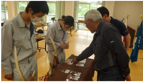
【講義「地域おこしの様々な活動」】