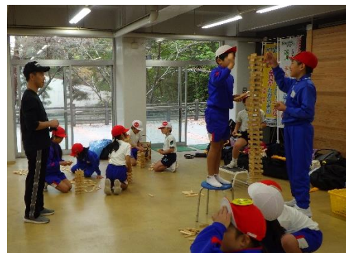
【遊びリンピック(カブラ積み)】