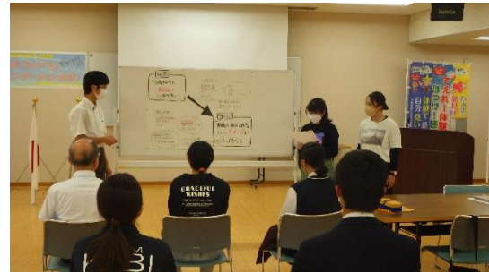
【講義・演習③「地域課題の探究」】