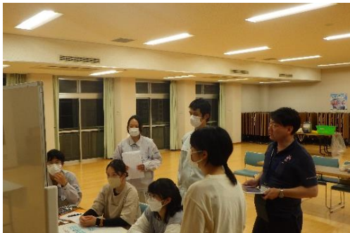
【講義・演習②「課題解決の基礎」】