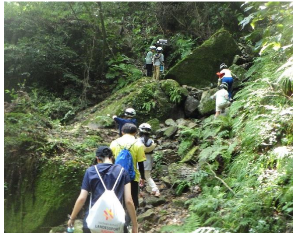
【アドベンチャーオリエンテーリング①】