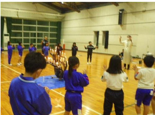
【キャンドルのつどい】