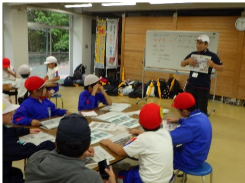
【野外炊事(新聞紙食器作り)】