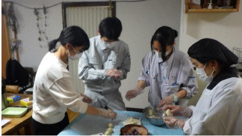
【フィールドワーク①】