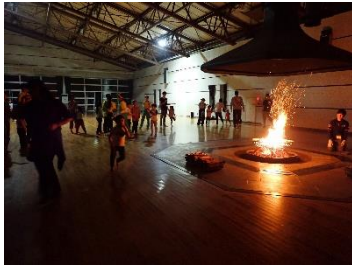
【キャンプファイヤー】