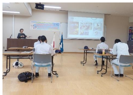
【講義「地域おこしの様々な活動」】