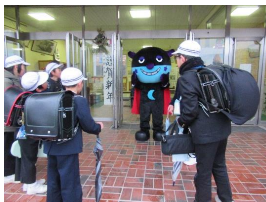
【あいさつ運動(小学校)】