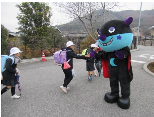
【あいさつ運動(小学校)】