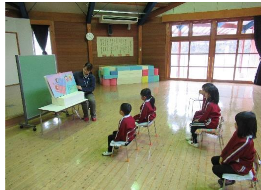
【絵本の読み聞かせ】