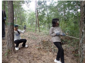
【ブラインドウォーク】